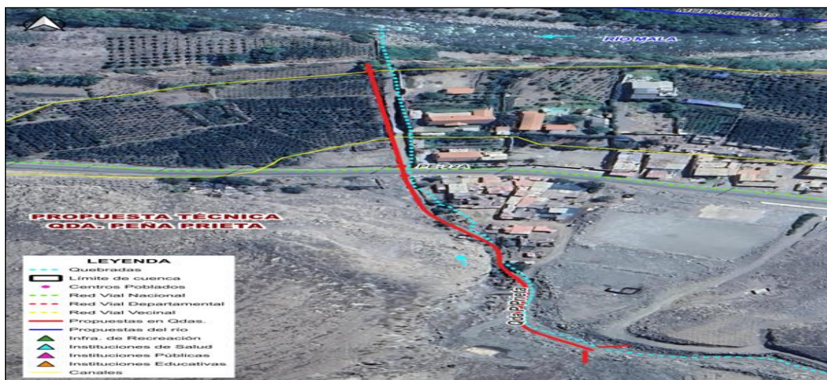
5.- IMAGEN SATELITAL DE ZONA VULNERABLE(GOOGLE EARTH)