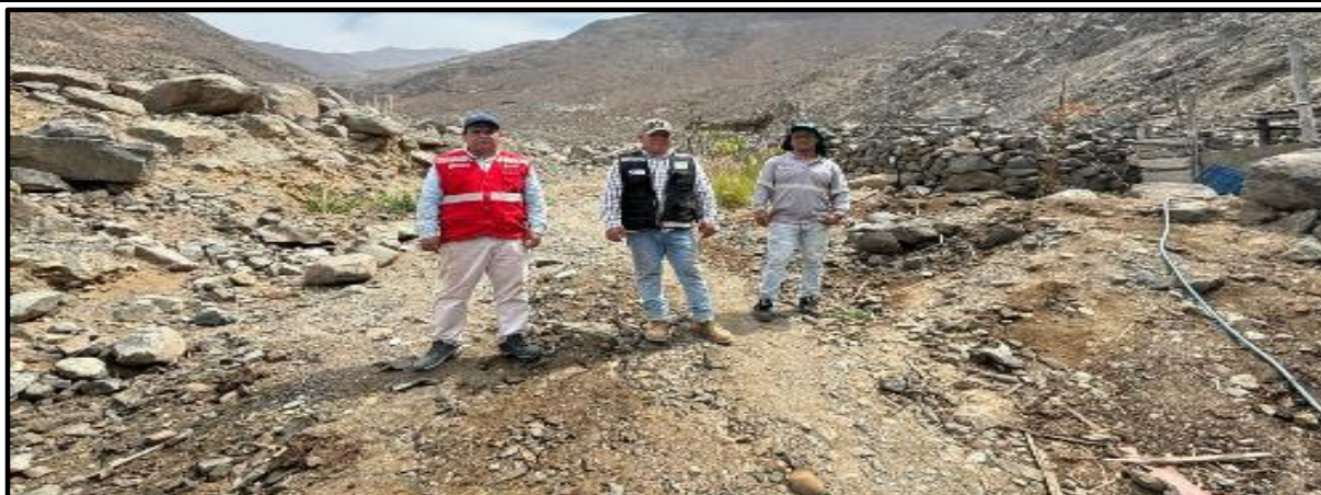
Foto 01: Cauce de la quebrada colmatada y con necesidad de hacer limpieza.